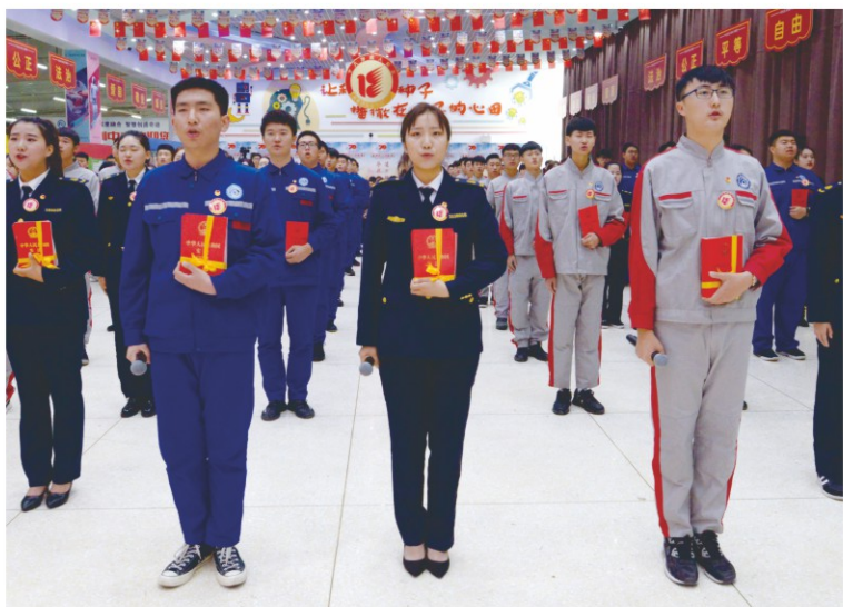
注：升学实验班具体招生计划及范围以上级部门审批为准。

● 优势三： 告别应试教育繁重的学业负担，提前确定升学目标，无需额外费用，避免不必要的补课花销，精准确定学习范围，让升学过程简单高效。